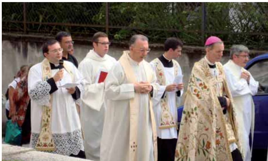
4 Processione a Gozzano, dalla tomba di P. Picco alla Cattedrale.

Il cammino esteriore da nord a sud è destinato, nel pensiero di Gesù, a diventare un cammino spirituale dei suoi discepoli. I quali ne hanno molto bisogno. Non sono ancora giunti alla maturità della fede. Quel viaggio è destinato a diventare il luogo più rilevante della loro conversione. Questo avverrà non senza fatica scoprendo, in maniera diretta, che Gesù non è un Messia potente secondo il mondo, ma un Messia sofferente secondo quanto già predetto dai profeti (cfr Isaia 42; 49; 52).