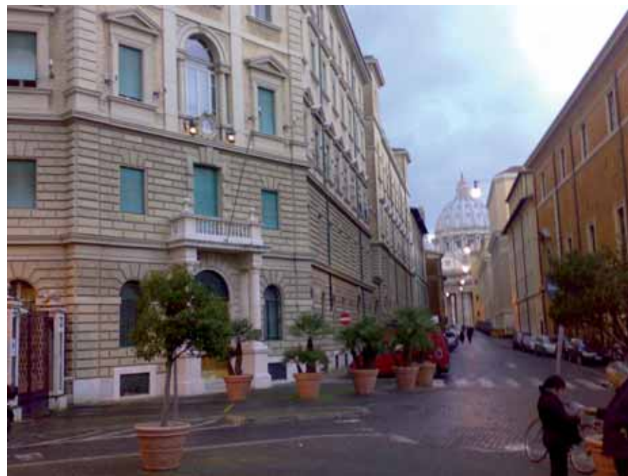
La Curia Generalizia dei Gesuiti a Roma, residenza del Preposito Generale.