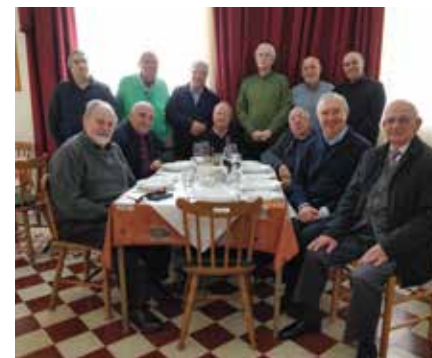
Ritiro a Gozo-Malta Quaresima 2018

Come ogni anno sono state realizzate le celebrazioni memoriali a Gozzano, Nole, Crissolo e Genova, in collaborazione con i parroci e le comunità ecclesiali delle diverse zone. Il Bollettino è uscito in tre numeri, relativi ai periodi del Santo Natale, della Pasqua e dell'estate.