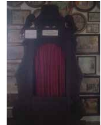
Confessionale di P. Picco a Crissolo

Tutti abbiamo bisogno di consolazione perché nessuno è immune dalla sofferenza, dal dolore e dall'incomprensione. Quanto dolore può provocare una parola astiosa, frutto dell'invidia, della gelosia e della rabbia! Quanta sofferenza provoca l'esperienza del tradimento, della violenza e dell'abbandono; quanta amarezza dinanzi alla morte delle persone care! Eppure,