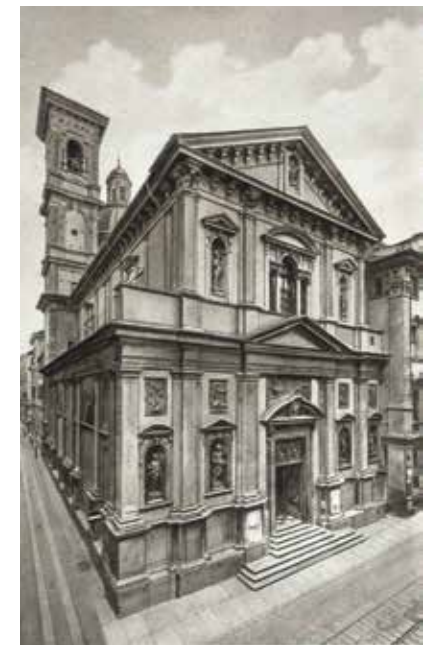
Chiesa santi Martiri

gnato alle messe di orario per i fedeli. Nel 1938 il 29 settembre era lunedì e vi ricorreva la festa del Martirio di Giovanni Battista, festa liturgica per la città di Torino, il cui Duomo è dedicato proprio a questo patrono. La santa messa a cui Padre Picco accenna fu celebrata alle 9.00, un'ora piuttosto tarda per quel tempo e quindi, come lui constatata nel suo scritto, fu poco partecipata: «Alle ore 9 vi era poca gente». Nonostante i fedeli in chiesa fossero pochi, tuttavia alcuni fecero la santa comunione, un evento piuttosto raro a quel tempo in quanto si richiedeva lo stato di grazia, con il digiuno e la partecipazione