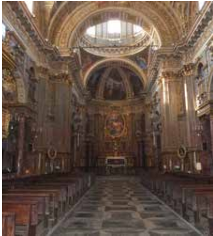
Chiesa santi Martiri

previa alla confessione. Padre Picco comunica alla sua lettrice di aver dato la comunione in due momenti, all'inizio della messa e al suo culmine: «diedi la Santa Comunione in principio della Messa e al Domine, non sum dignus », quindi ci fu qualcuno che richiese la comunione prima della celebrazione, secondo le consuetudini del tempo, per poi uscire e recarsi alle sue attività lavorative o familiari. Non sappiamo quante persone ricevettero la comunione in quella celebrazione sommando il primo e il secondo momento. Il biglietto riporta però la nota interiore di cui si è accennato, una confidenza importante per la conoscenza del cuore sacerdotale di Padre Picco: aver dato la santa comunione ai fedeli gli ha procurato una grande gioia, un sen-