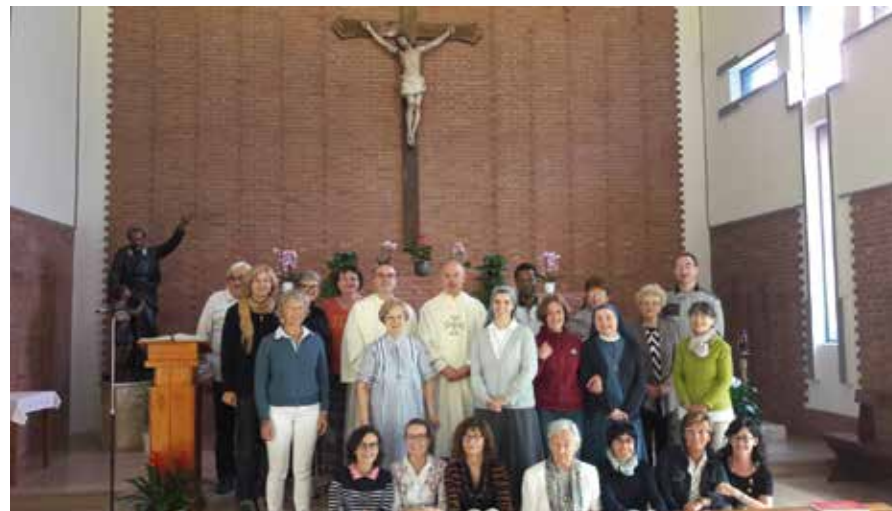
Esercizi spirituali estivi a San Mauro Torinese