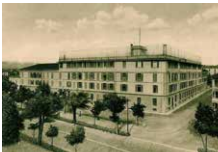
Collegio san Tommaso di Cuneo

La lettera è stata scritta il giovedì 26 ottobre del 1916. In quel momento l'Italia era in guerra con l'Austria, erano già state combattute sei battaglie sull'Isonzo ed era già stata redenta Gorizia, nella lunga e cruenta battaglia dal 4 al 8 agosto 1916. I soldati tornavano dal fronte con ferite da arma da fuoco, ma anche da taglio, in quanto gli scontri a corpo a corpo erano ancora frequenti. All'inizio della