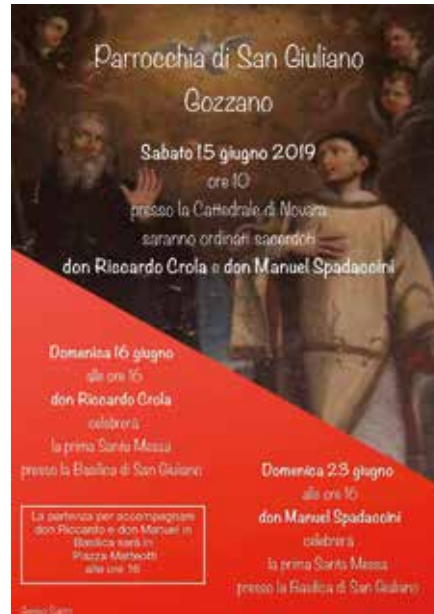
Prime messe a Gozzano