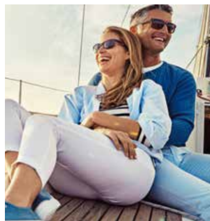
Ricchezza, salute e prestigio

È perciò necessario renderci indifferenti rispetto a tutte le cose create, in tutto quello che è lasciato al nostro libero arbitrio e non gli è proibito; in modo che, da parte nostra, non vogliamo più salute che malattia, ricchezza che povertà, onore che disonore, vita lunga che breve, e così via in tutto il resto; solamente desiderando e scegliendo quello che più ci conduce al fine per cui siamo creati. [ES 23]