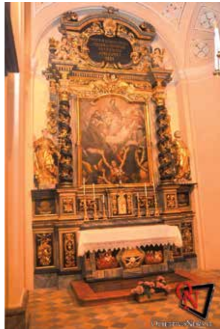
Altare Madonna del suffragio di Nole