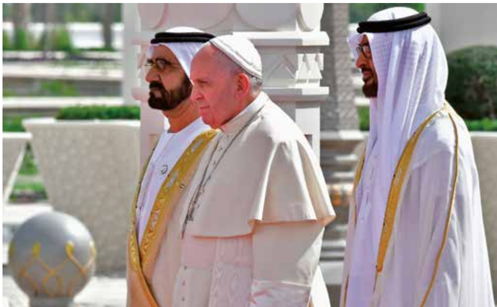
Papa Francesco in visita agli Emirati Uniti

Insomma, le opere di misericordia corporale e spirituale costituiscono fino ai nostri giorni la verifica della grande e positiva incidenza della misericordia come valore sociale. Essa infatti spinge a rimboccarsi le maniche per restituire dignità a milioni di persone che sono nostri fratelli e sorelle, chiamati con noi a costruire una «città affidabile». [19]