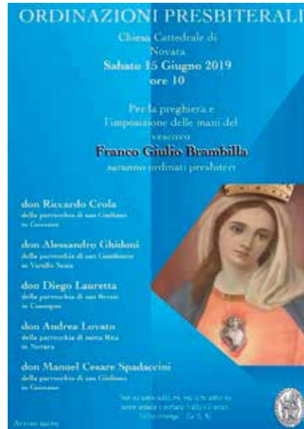
Ordinazioni a Novara

In questo bollettino facciamo ancora un confronto tra gli insegnamenti di Papa Francesco e la vita di Padre Picco. Entrambi erano gesuiti, condividevano la stessa spiritualità e il medesimo modo di vivere; infatti leggendo le parole di Papa Francesco e guardando alla vita di Padre Picco si scoprono delle meravigliose corrispondenze: stessa vita di preghiera, stessa preferenza per le persone bisognose, stessa modalità relazionale con i fedeli. Credo che dovremmo riflettere tutti