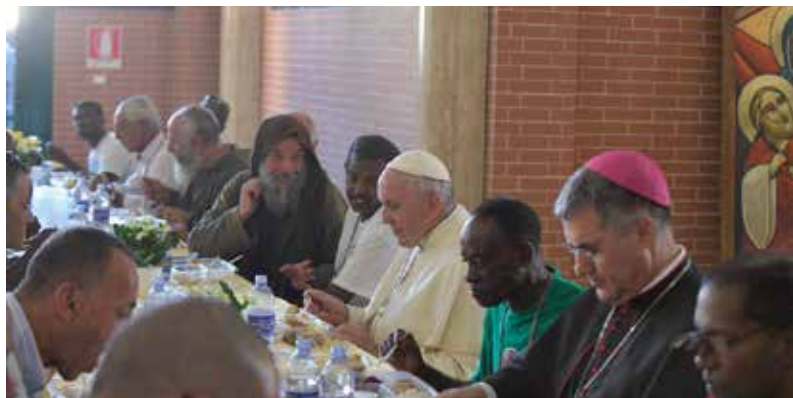
Papa Francesco a mensa con i poveri in Sicilia

fanno mancare la solidarietà ai più poveri e infelici. Ringraziamo il Signore per questi doni preziosi che invitano a scoprire la gioia del farsi prossimo davanti alla debolezza dell’umanità ferita. Con gratitudine penso ai tanti volontari che ogni giorno dedicano il loro tempo a manifestare la presenza e vicinanza di Dio con la loro dedizione. Il loro servizio è una genuina opera di misericordia, che aiuta tante persone ad avvicinarsi alla Chiesa.