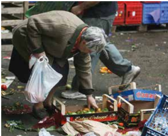
Povertà, malattia ed emarginazione

La virtù della santa indifferenza verso la ricchezza e la povertà è anche una virtù sociale, in quanto rende possibile la giustizia. Ci si può chiedere: "Come si può esercitare un servizio pubblico senza la virtù della